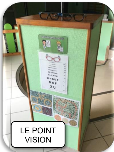
LE POINT VISION

Etiquettes d'inscription et de répartition des rôles :