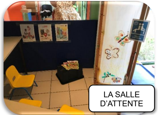
LA SALLE D'ATTENTE