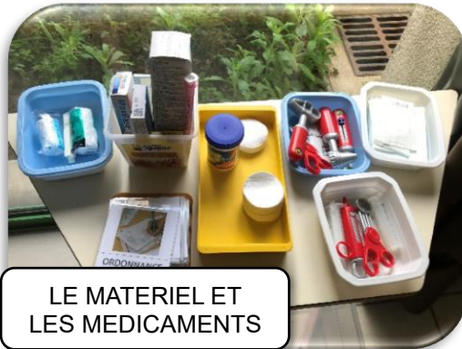
LE MATERIEL ET LES MEDICAMENTS